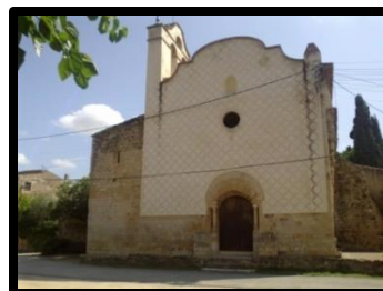
Iglesia de Sant Pol ↑

Delante de la iglesia de Sant Pol hay un pequeño aparcamiento, con una fuente y bancos a la sombra. Podemos dejar el coche aquí. Enfilamos el GR92.1 . Después de unos 5 minutos de ruta, veremos a nuestra izquierda un manso muy grande ( Can Salvà ). Giraremos por un pequeño sendero a la izquierda justo después de la alberca de Can Salvà. Continuaremos siguiendo el GR hasta los pozos de hielo y la fuente de Salomó (no siempre tiene agua!!), donde encontraremos un panel informativo. Encima de la fuente encontraremos un primer pozo de hielo sin cubierta, pero si subimos un poco más arriba veremos otro mejor conservado. Continuaremos siguiendo la señalización del GR hasta llegar a un cruce , donde tomaremos el desvío a la derecha ( dejando de seguir la señalización del GR92.1 , que continua recto hasta el Mas Secot). Así pues, volveremos a llegar a la alberca de Can Salvà, donde antes hemos girado, y desharemos el camino hasta Sant Pol.