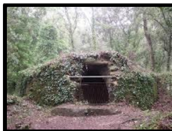
↓ Pozo de hielo