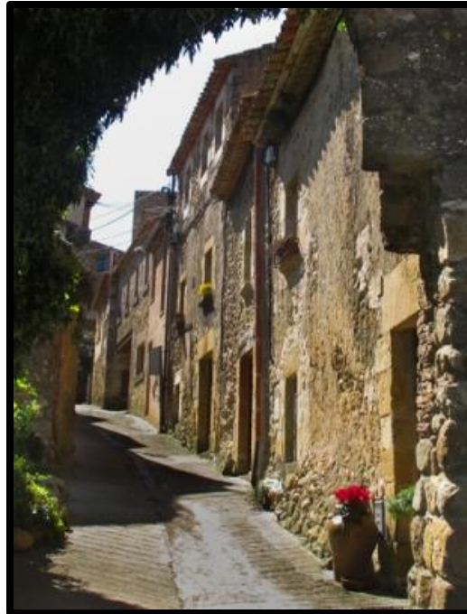
Nucli medieval de Castell d'Empordà

veurem al marge dret. Després de passar per la font del Remei ens enfilarem (30 m de desnivell) al conjunt monumental del Castell d'Empordà, on trobarem un mirador per poder divisar bona part de l'Empordà i recorrerem el seu únic carrer, en direcció sud. Continuarem pel camí enjardinat que porta des de l' hotel a la carretera. Travessem la carretera i ens enfilem al turó de Marenys. Continuem com indica el mapa, deixant a la dreta el Club de Tennis , fins a la urbanització. Girarem a la dreta i agafarem el carrer Països Catalans fins a la carretera de Castell d'Empordà. on girarem a l'esquerra i baixarem fins el col·leci, tornant a girar a la dreta fins a arribar a la zona esportiva (punt de sortida).