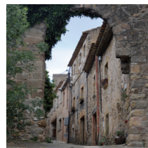
Castell d'Empordà