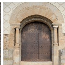
Església de Sant Pol