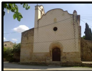
Església de Sant Pol ↑ ↓ Pou de glaç

Davant de l'església de Sant Pol hi ha un petit aparcament amb una font i uns bancs amb ombra. Podem deixar el cotxe aquí. Enfilem el GR92.1 . Després d'uns 5 minuts de ruta, veurem a la nostra esquerra un mas molt gran ( Can Salvà ). Girarem per un petit sender a l'esquerra just després del safareig de Can Salvà. Continuem seguint el GR fins als pous de glaç i la Font d'en Salomó (no sempre té aigua!!), on hi trobarem un panell informatiu. A sobre de la font, trobarem un primer pou de glaç sense coberta, però si pugem una mica més amunt en veurem un altre de més ben conservat. Continuem seguint les marques del GR fins arribar a una cruïlla , on agafarem el trencant a mà dreta ( deixant de seguir la senyalització del GR , que continua recte cap al Mas Secot). Així doncs, tornarem arribar a la paret del safareig de Can Salvà, on abans hem girat, i desfarem el camí fins a Sant Pol.