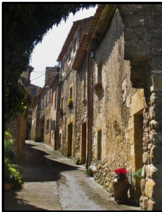
Núcleo medieval de Castell d'Empordà

Continuaremos por el camino ajardinado que lleva del hotel a la carretera. Cruzaremos la carretera y subiremos a la colina de Marenys. Continuaremos tal como indica el mapa, dejando a la derecha el Club de Tennis hasta la urbanización. Giraremos a la derecha y cogeremos la calle Paisos Catalans hasta la carretera de Castell d'Empordà, donde giraremos a la izquierda y bajaremos hasta la escuela, volviendo a girar a la derecha hasta llegar de nuevo a la zona deportiva (punto de salida).